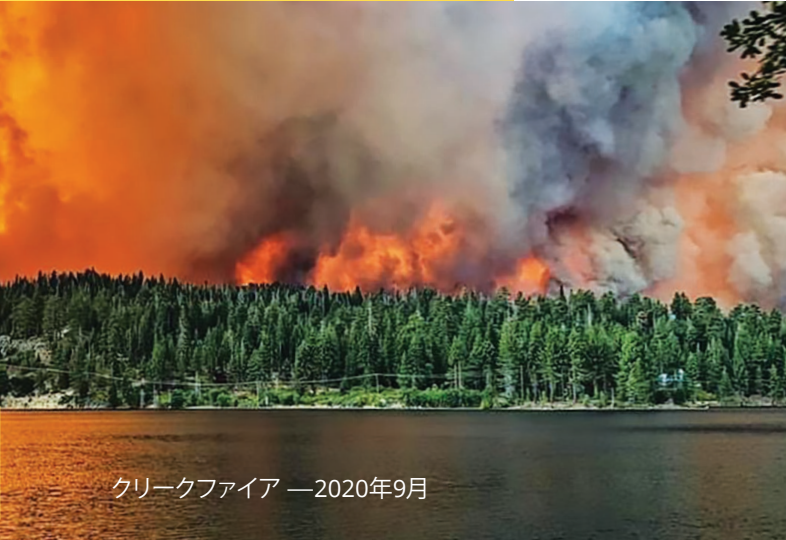
クリークファイア — 2020年9月